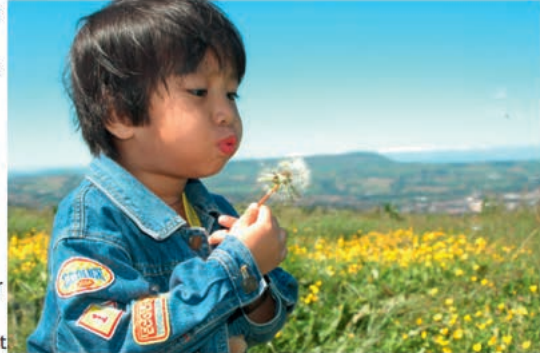
Abb. 2:

als Linkgeber ungeeignet ist. Daher werden Webseiten oftmals mit minderwertigem, schnell zusammengeschriebenem oder zusammenkopiertem Content gefüllt, der für den Leser keinen brauchbaren Mehrwert hat. Diese Entwicklung hat den Begriff „Contentfarm“ maßgeblich geprägt und infolgedessen haben die Suchergebnisse laufend an Qualität eingebüßt.